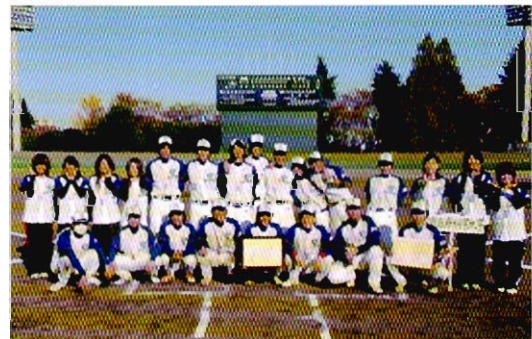
準優勝した軟式野球部員